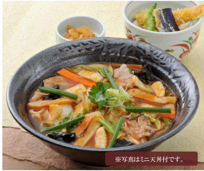
※写真はミニ天丼付です。

「むぎの里」自慢のかけつゆを、たっぷりの野菜とピリッと胡椒をきかせた醤油仕立てのスープでお楽しみ下さい。