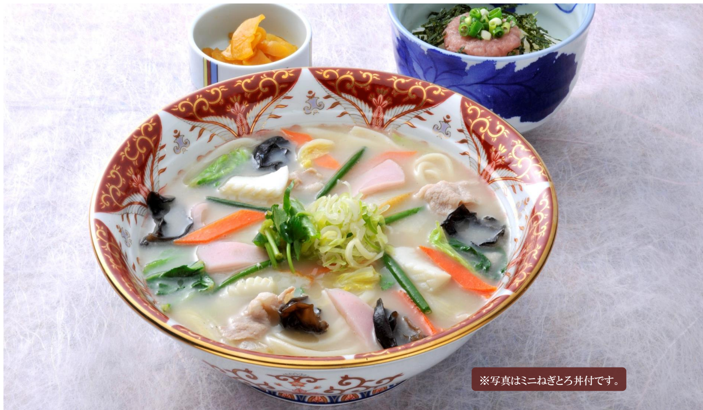
※写真はミニねぎとろ丼付です。