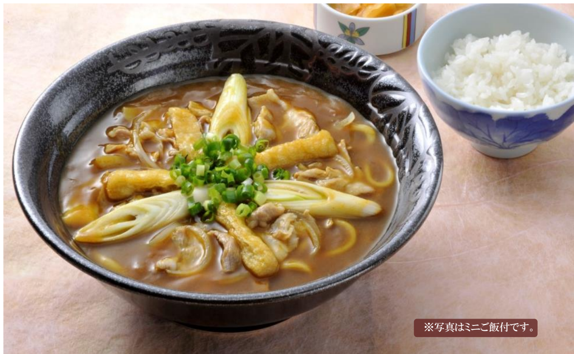
※写真はミニご飯付です。