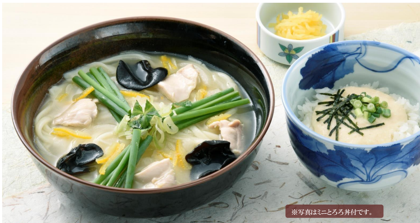
※写真はミニとろろ丼付です。