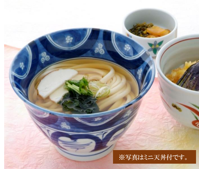
※写真はミニ天丼付です。

鶏肉を煮込んだスープに、塩麴を加えました。 あっさりとした塩味のスープを、 柚子と胡椒の香りでお楽しみ下さい。