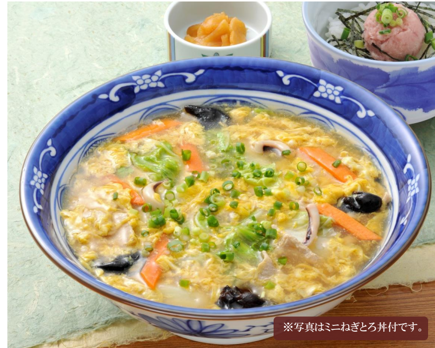
※写真はミニねぎとろ丼付です。

醤油味ベースのつゆに、豆板醤とコチジャンの辛さがたまらないちゃんぽんうどんです。