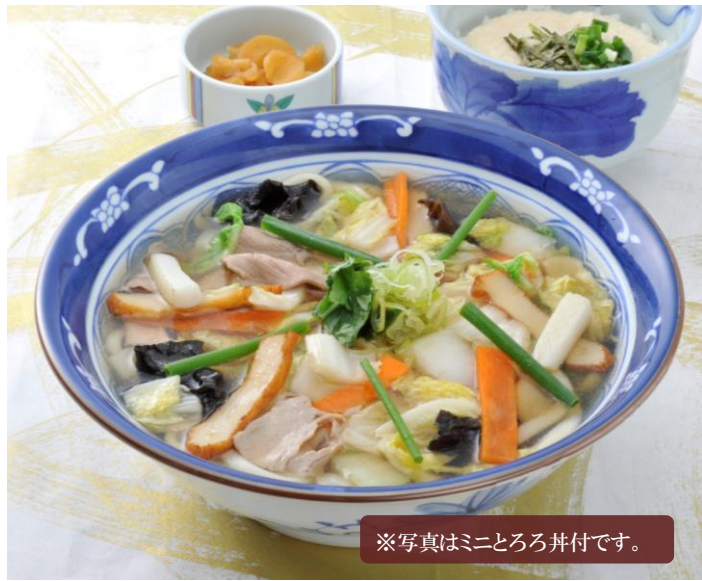
※写真はミニとろろ丼付です。