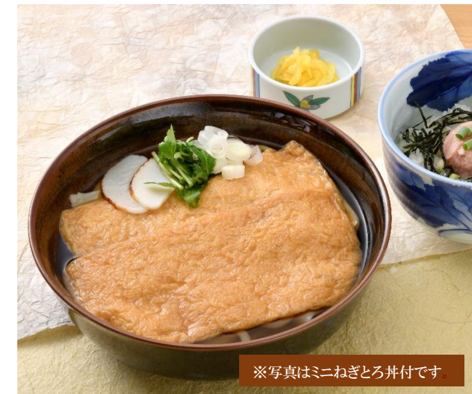
※写真はミニねぎとろ丼付です。