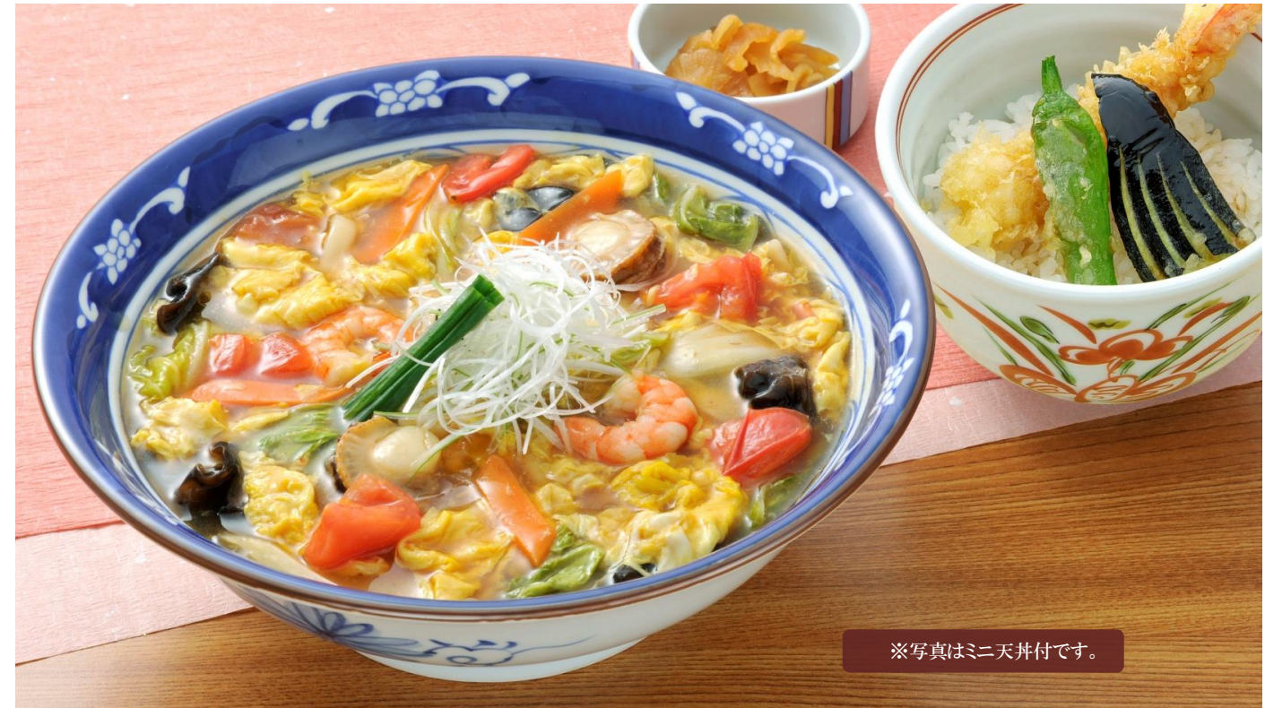
※写真はミニ天丼付です。

コラーゲンが嬉しい白湯スープと、「むぎの里」自慢の「かけつゆ」で作ったちゃんぽんスープが人気です。7種類の具材と一緒にどうぞ。