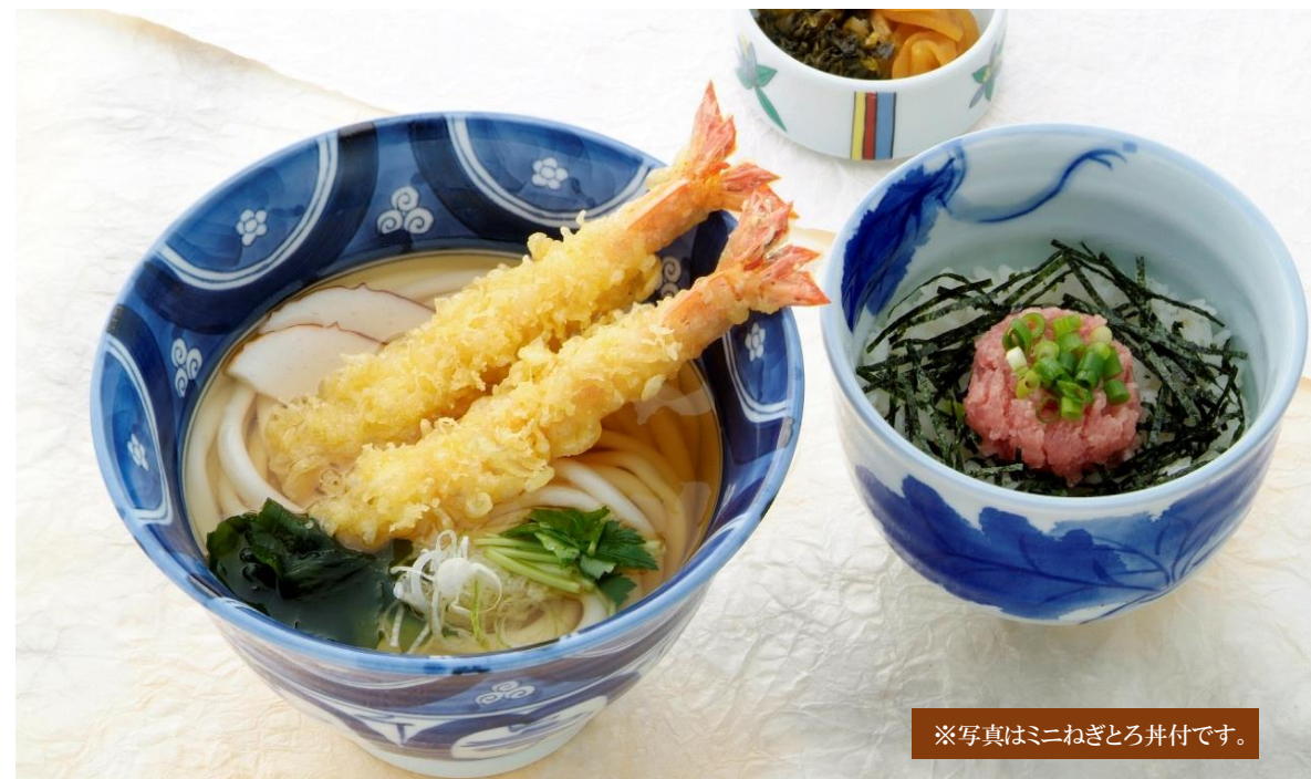
※写真はミニねぎとろ丼付です。